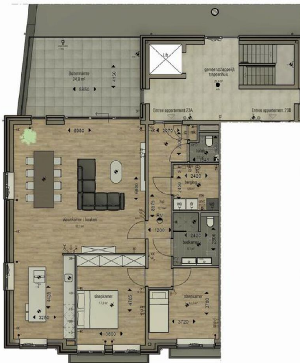
Plattegrond appartement 23A