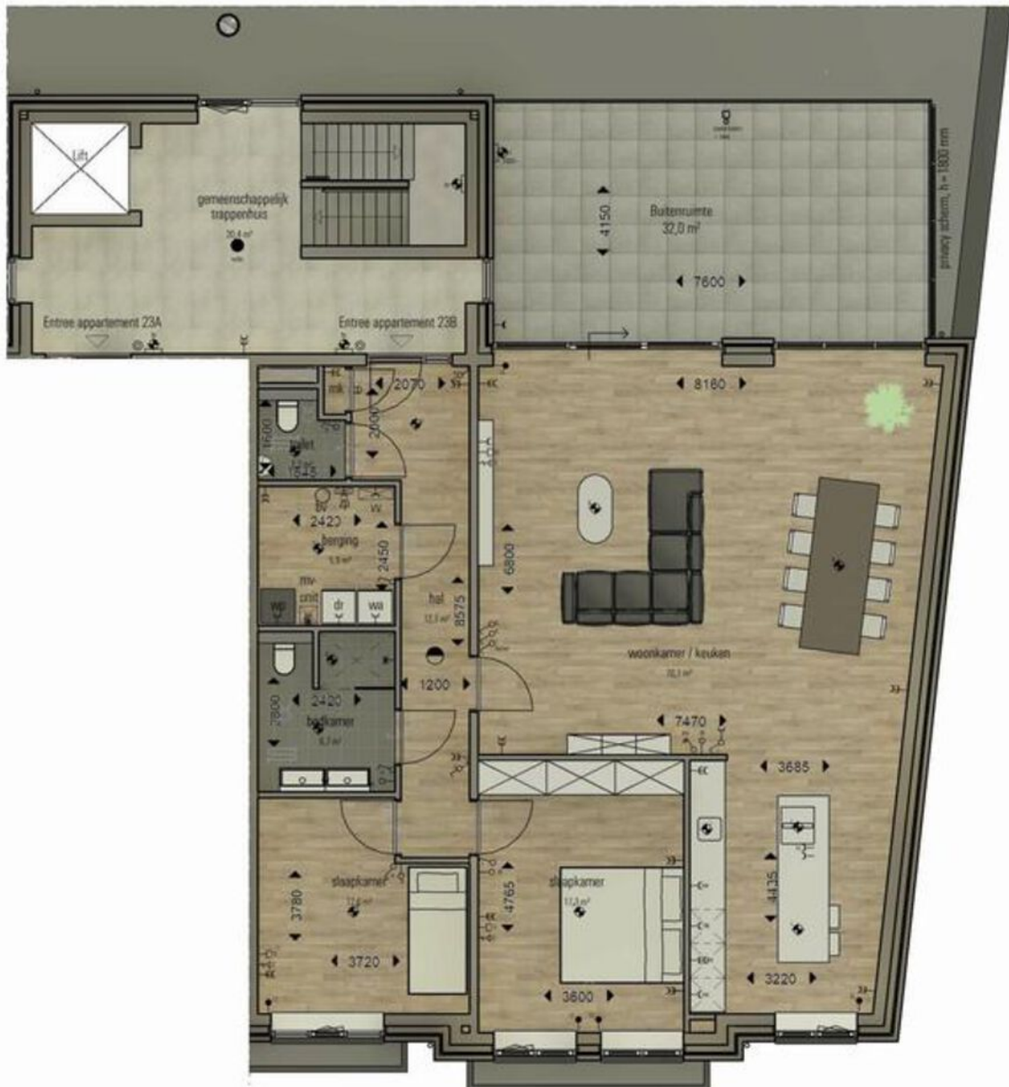
Plattegrond appartement 23B