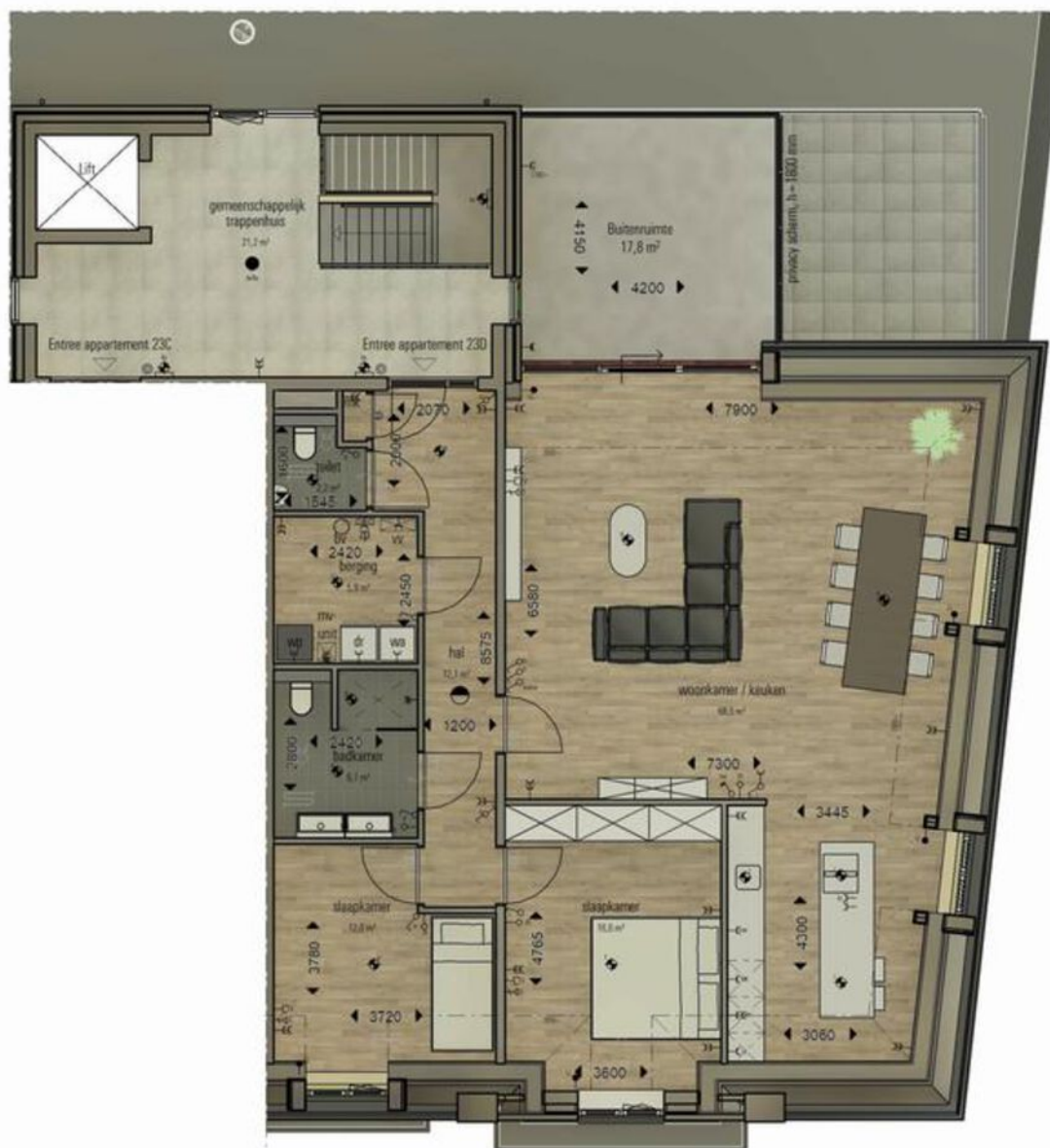
Plattegrond appartement 23D